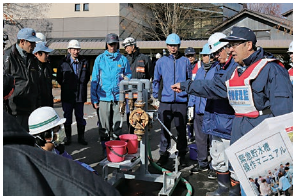
いざという時、地域の皆さんの助けに

11月10日(日)に五戸町図書館の緊急貯水槽を使用した防災訓練が、五戸町の自治会、消防団、消防署、役場の方々など総勢53名が参加して行われました。冷たい風の吹くあいにくのお天気でしたが、企業団の説明に熱心に耳を傾け、貯水槽から水を汲み上げる手順の実演では、活発な質疑応答が行われました。訓練に入ると本番さながらの真剣な表情と動きで寒風など何のその！熱気に包まれていました。