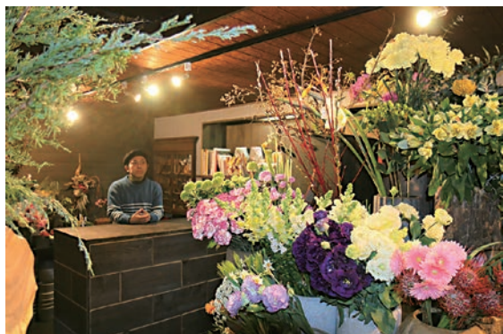
店内の雰囲気は下北沢時代とあまり変わらない

帰国後すぐに中目黒の有名店へ。6年間の厳しい修行の後、2011年11月に独立。半年間の路上販売を経て、下北沢にお店をオープンさせた。