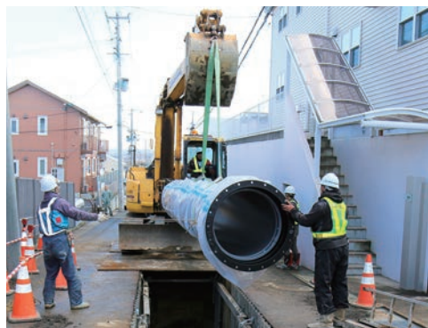
水道管の更新工事(口径80cm)