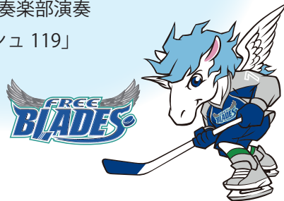
東北フリーブレイズ