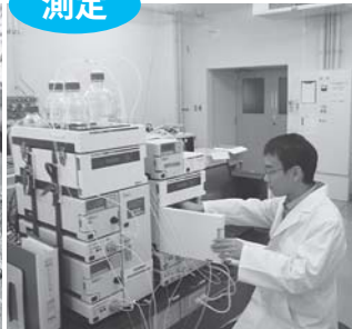
陰イオン類の検査