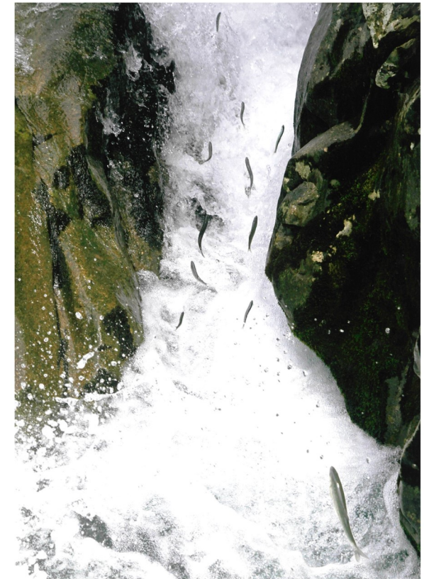
平成28年写真コンテスト入選(堀内勇氏)