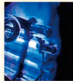
紫外線装置内部のようす

装置内には蛍光灯のようなランプが配置されています。これが発光し、紫外線を照射することで水を消毒します。