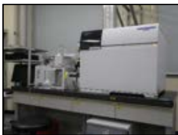
▲誘導結合プラズマ質量分析計 (金属類の分析)