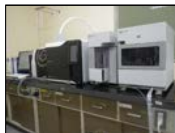
▲パージ・トラップ-ガスクロマトグラフ質量分析計 (揮発性有機化合物・かび臭原因物質の分析)