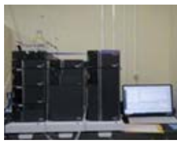
▲ポストカラム-イオンクロマトグラフ (臭素酸の分析)