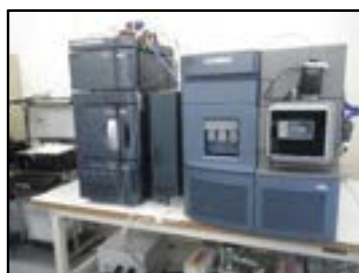
▲液体クロマトグラフ質量分析計 (農薬類、有機フッ素化合物の分析)